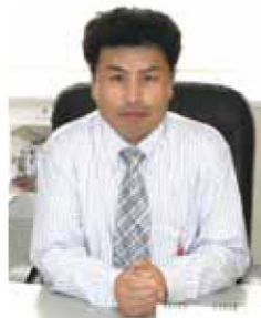
代表取締役 一級建築士